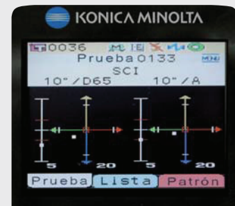
Gráfico de diferença de cor