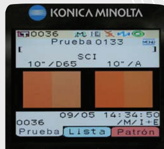
Simulação de cor